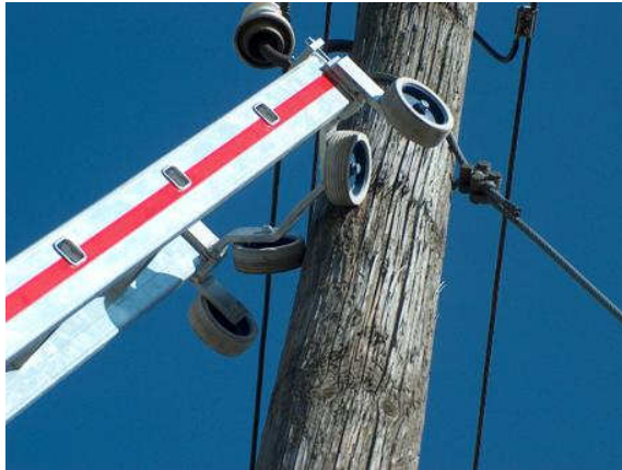
Universal- Mastanleger am Mast